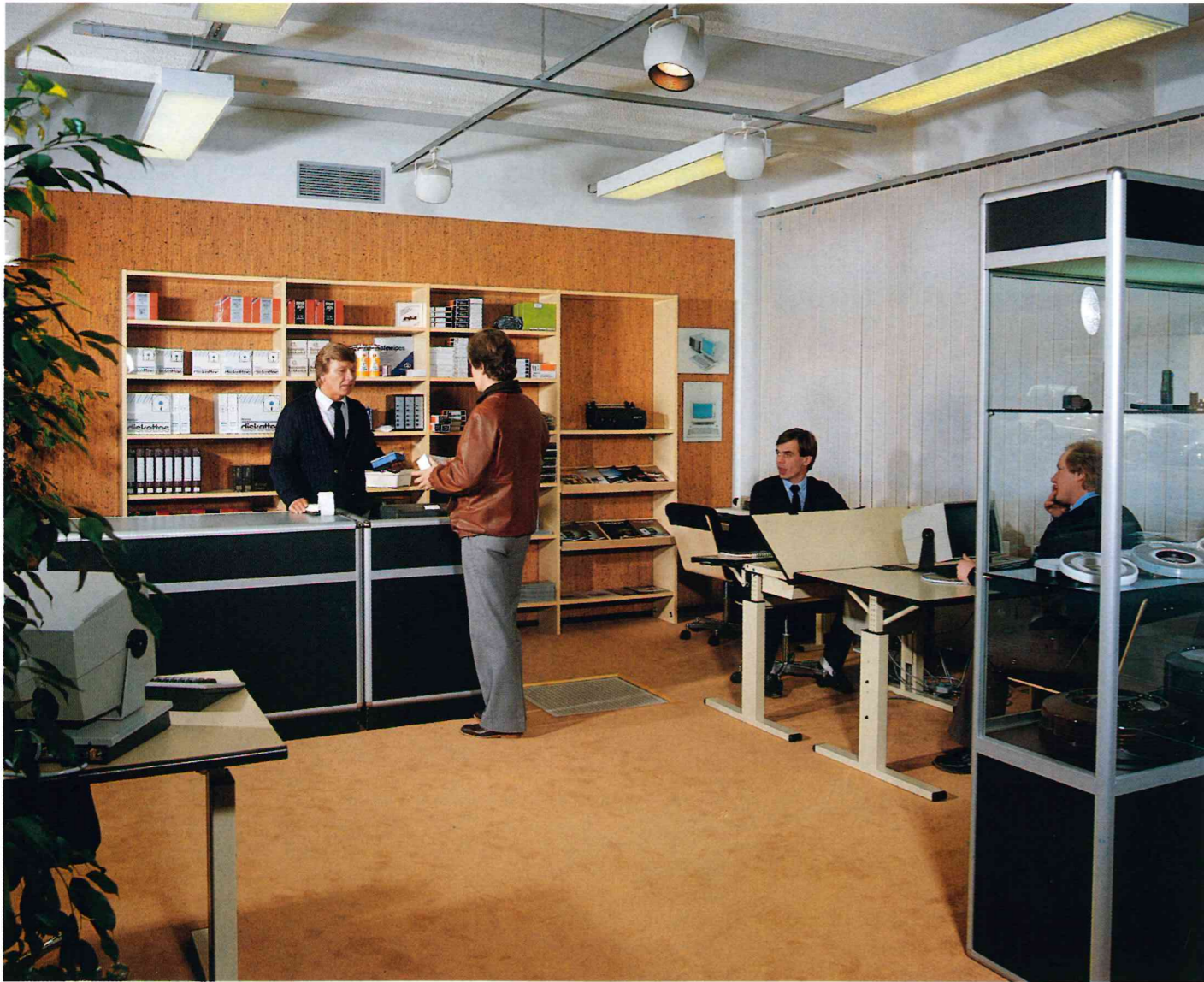
Nokia Datan tietokonemyymälä avattiin Tampereella.

MikroMikkojen jälleenmyyntitoiminta kehittyi vuonna 1983 suotuisasti. Yhteistyötä tiivistettiin eri paikkakunnilla toimivien alueellisesti vahvojen jälleenmyyjien, sekä tiettyihin erikoisaloihin keskittyneiden jälleenmyyjien kanssa. Voimakkaasti lisääntyneen ohjelmistotuotannon myötä MikroMikon käyttöalueet laajenivat monille uusille alueille kuten apteekit, graafinen teollisuus, oppilaitokset, LVI- ja sähköurakoitsijat sekä PK-yritysten taloushallinto. Tehokkaan jälleenmyyntitoiminnan ansiosta MikroMikko saavutti markkinajohtajan aseman Suomessa ammattikäyttöön tarkoitetuissa mikroissa.