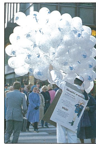
Kansikuva: Mikonpäivä näkyi myös Helsingin katukuvassa. Keskipäivän ajan teekkarit jakoivat Marskin edustalla 5000 Mikko-ilmapalloa.