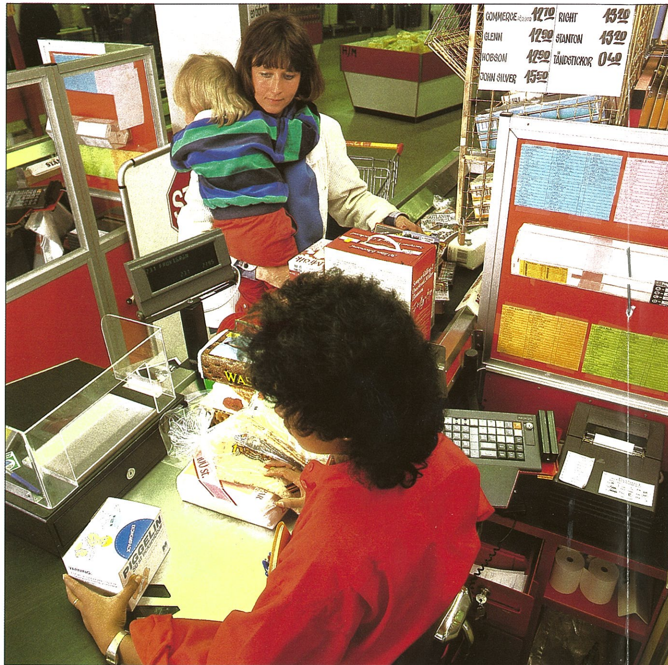
Teksti: Maarit Oikarinen Kuvat: Catharina Biesert

On huonompiakin tapoja huvitella kuin katsella kauppoja aurinkoisessa Tukholmassa. Putiikkeja on paljon, ne ovat lähekkäin, kaikkea mielenkiintoista löytyy. Puhumattakaan Nokian myymäläjärjestelmistä, jotka myyjien apuna takaavat asiakkaalle nopean ja luotettavan palvelun.